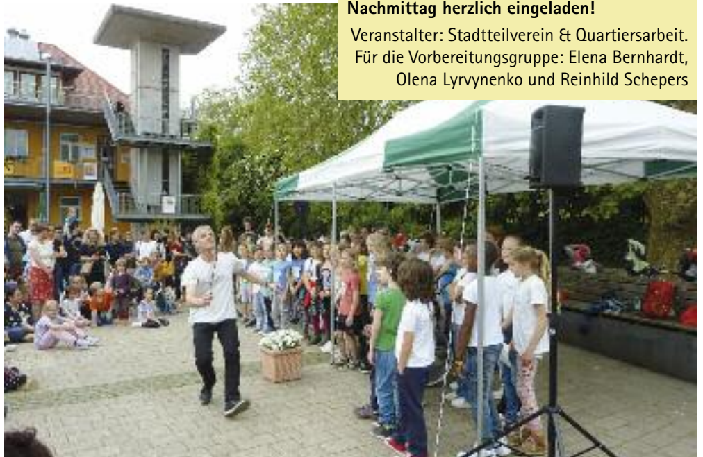
Auftritt des Kinderchors der Karoline-Kaspar-Schule beim Spieletag 2023.

Veranstalter: Stadtteilverein & Quartiersarbeit. Für die Vorbereitungsgruppe: Elena Bernhardt, Olena Lyrwynenko und Reinhild Schepers