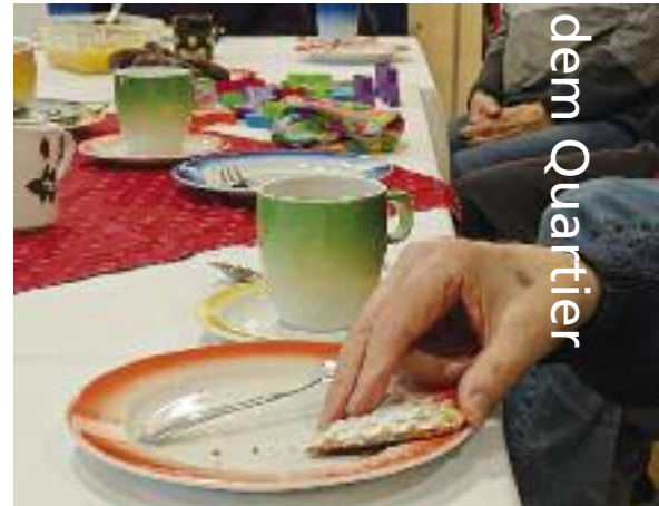
Das monatliche Café WOGÉ ist ein gern besuchter Begegnungsort. ...

Als sich aber kurz später die Enkelin einer Helferin zu ihr setzte, sie ansprach und mit Klötzen zu bauen anfang, war sie gleich mit Begeisterung dabei und gemeinsame Türme wuchsen in die Höhe.