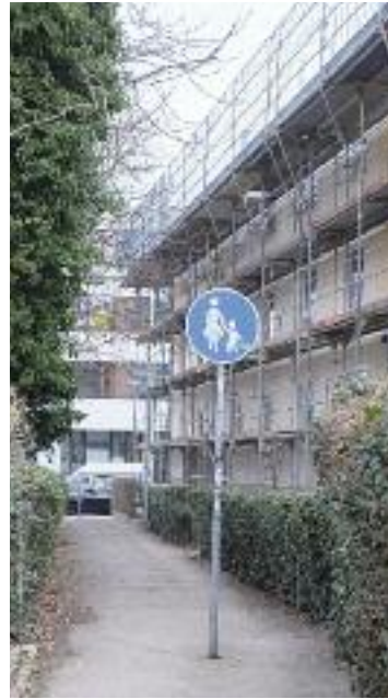
Foto links: Der offizielle Abzweig von der Oltmanns- zur Lange- markstraße ist zu schmal für Radgegenverkehr.