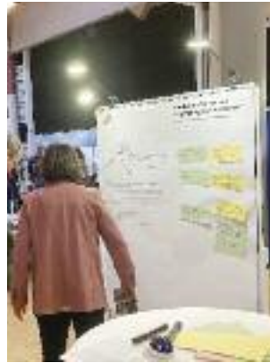
Kurzkomentare waren schon beim DB-Termin am 06.03. möglich.

Dieses Thema betrifft alle in der Nähe der Gleise wohnenden BewohnerInnen im Südwesten von Vauban unmittelbar. Der Vorstand des Stadtteilvereins Vauban