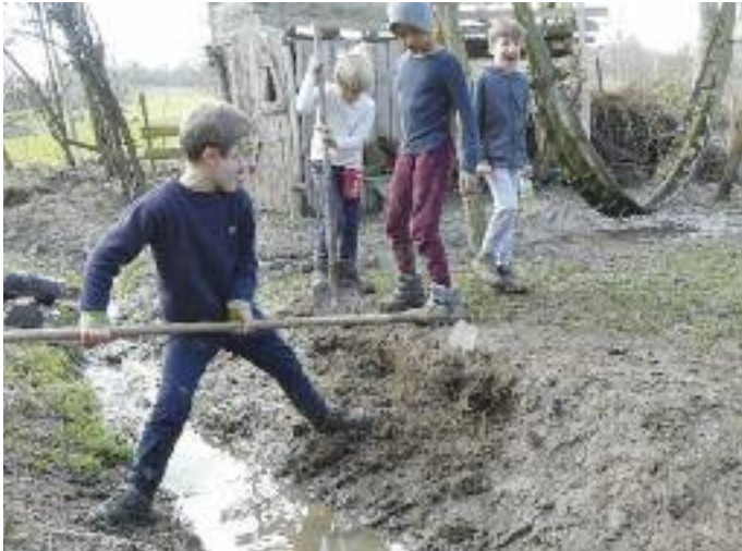
Faschingsferien: Matsch to do. Oben rechts: Die Wiesengruppe chillt.