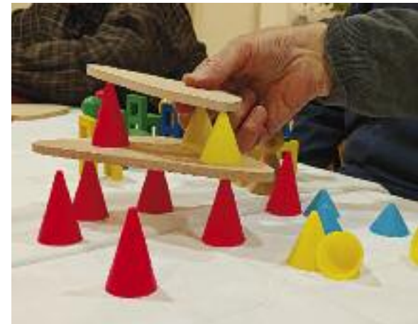
Hier wird dann auch gesungen, erzählt, gespielt oder gebaut.

Für Angehörige ist das Café ein willkommener Ort, sich offen mit anderen Betroffenen austauschen zu können. Dann gibt es für sie auch die Gelegenheit, mit Ehrenamtlichen des WOGÉ-Vereins in Kontakt zu treten, Fragen zur Demenz-WG zu stellen oder sich über die Angebote des Vereins zu informieren, zu denen auch ein Kurs für Angehörige Demenzbetroffener gehört.