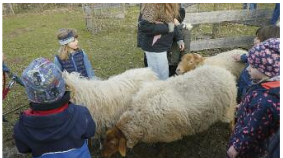
Feste (ääh, flauschige) Schafgruppe

Alle aktuellen wichtigen Infos auch zur Anmeldung, Registrierung etc. unter: https://kinderabenteuerhof.de/ferienprogramme/