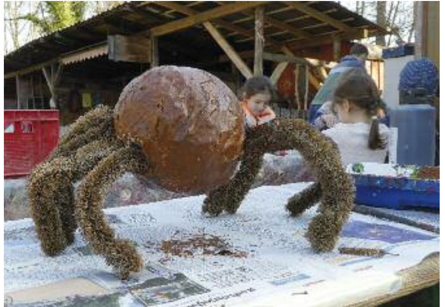
Mit allen Sinnen – Filzen, Backen, Tönen, Spinnen ... Impressionen vom Faschingsprogramm.

Bei strahlendem Sonnenschein haben wir ein buntes Faschingsferienprogramm erlebt mit Filzen, Backen, Tönen, Vorlesen, Pferde versorgen, Schafspaziergang ... Herrlich.